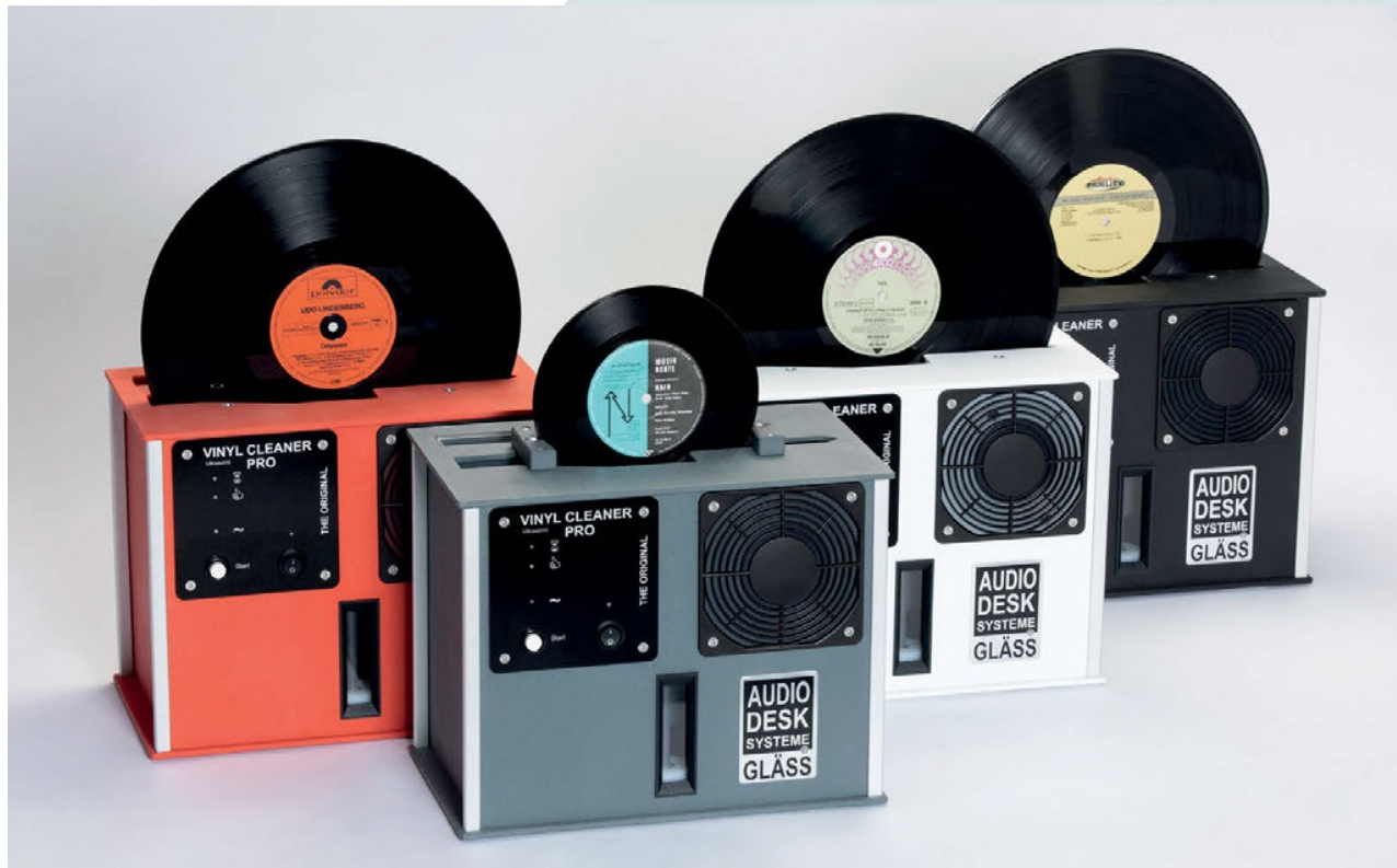
Farbvarianten des Vinyl Cleaner Pro für LPs und 7-inch-Singles

Jeder Besitzer einer hochwertigen Musikanlage hat bereits erlebt, wie mit Freude benutzte Geräte auf einmal nicht mehr tadellos funktionieren. Leider musste ich schon viele geliebte Teile meiner Anlage buchstäblich wegwerfen, weil die Herstellerfirma keine Ersatzteile mehr auf Lager hatte bzw. verkaufte. Es geht zum Glück auch anders. VON PETER TRÜBNER